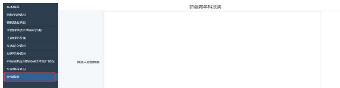
图 23: 专家业绩摘要

填写并保存个人基本情况信息之后，点击科技成果应用情况或技术推广情况菜单，填写相关信息，如图 23 所示。