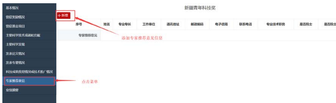
图 22: 专家推荐意见