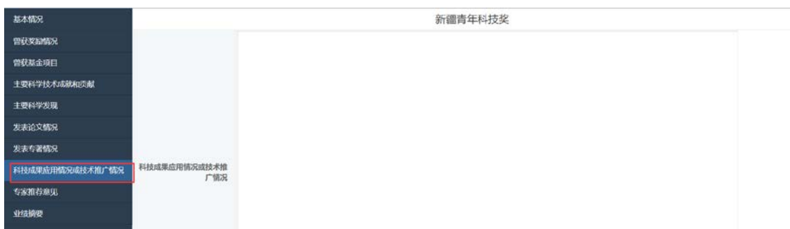
图 21: 科技成果应用情况或技术推广情况

填写并保存个人基本情况信息之后，点击科技成果应用情况或技术推广情况菜单，填写相关信息，如图 21 所示。