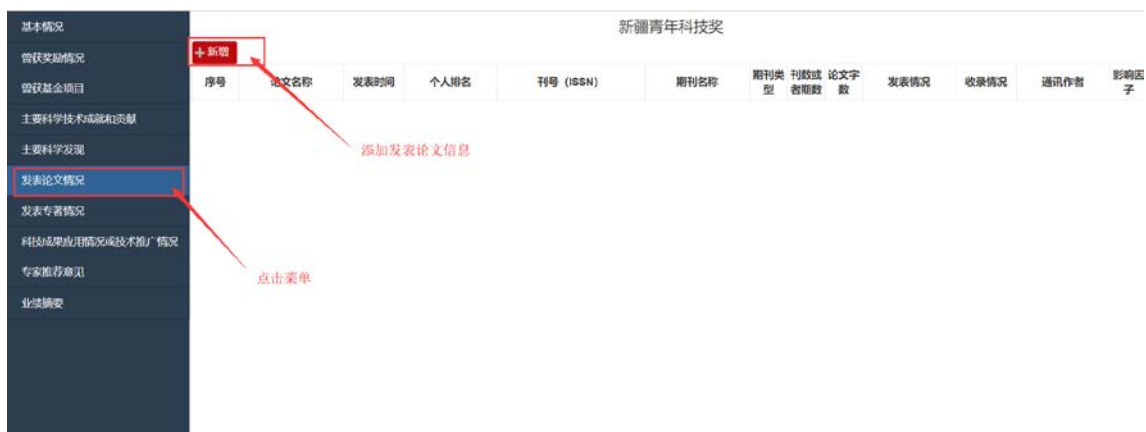
图 19: 发表论文情况