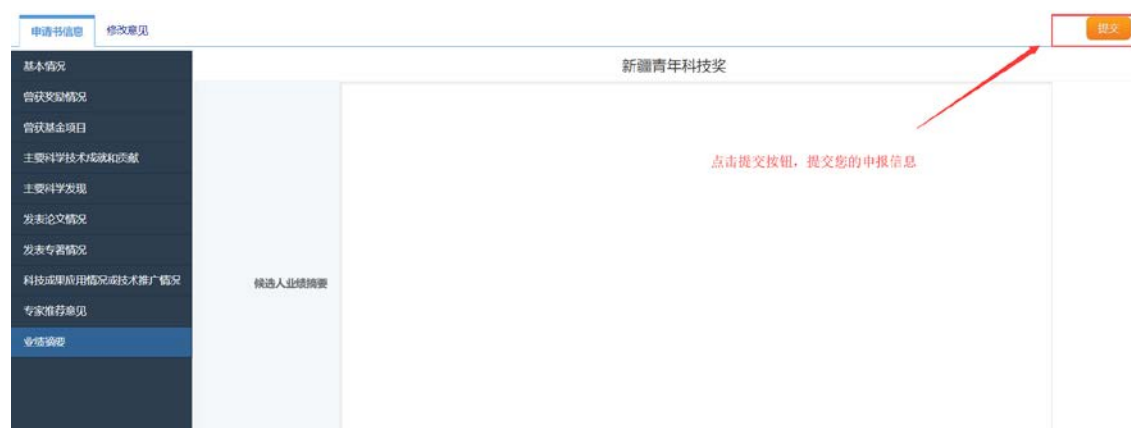
图 24: 提交信息

当您确认您填写的信息无误、信息完善后，提交审核，如图 24 所示，点击提交按钮，上报您的信息。点击提交之后回到我的申请页面(如图 25 所示)，在申请页面就会看到您提交的信息，具体信息审核流程走在哪一步了，都会显示。提交之后，随时留意审核信息，如果被退回，请根据退回的信息提示完善自己的申报信息。