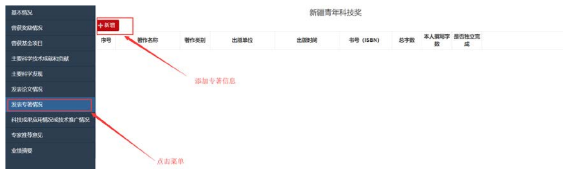
图 20: 发表专著情况

填写并保存个人基本情况信息之后，点击发表专著情况菜单，填写相关信息，如图 20 所示。