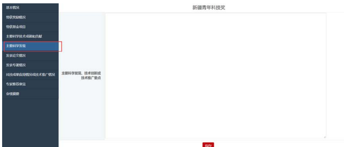
图 18: 主要科学发现

填写并保存个人基本情况信息之后，点击主要科学发现菜单，填写相关信息，如图 18 所示。