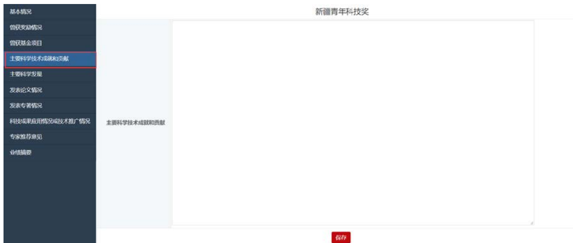
图 17: 主要科学技术成就和贡献

填写并保存个人基本情况信息之后，点击主要科学技术成就和贡献菜单，填写相关信息，如图 17 所示。